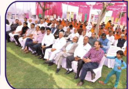
राष्ट्रीय मिर्गी दिवस 2019 के उपलक्ष में आयोजित कार्यक्रम में उपस्थित समाज के विशिष्ट अतिथिगण