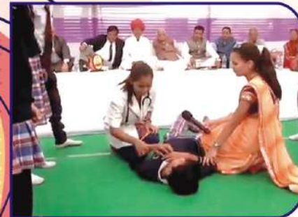
मासिक केम्प में राष्ट्रीय मिर्गी दिवस 2019 के उपलक्ष में स्कूल के बच्चों द्वारा संक्षिप्त मिर्गी नाटिका का प्रदर्शन करते हुए।