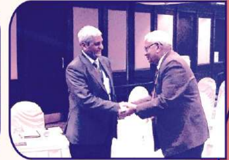
अखिल भारतीय मिर्गी संगठन के वार्षिक अधिवेशन 2015 में भाग लेते हुए एवं घेवरचन्द श्रीश्रीमाल पुरस्कार प्राप्त करते हुए