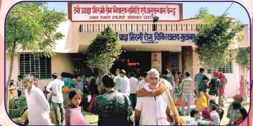
गुलाबपुरा स्थित परिसर में आयोजित कैम्प में आते रोगी।