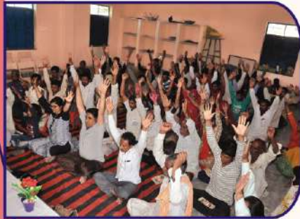
योगा विशेषज्ञ द्वारा रोगियों को योगाभ्यास कराते हुए।