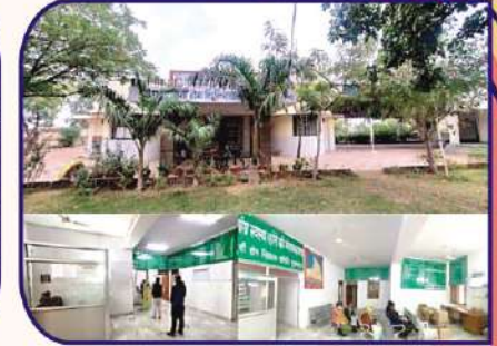
प्राज्ञ मिर्गी रोग निवारक समिति के परिसर का बाह्य एवं आन्तरिक दृश्य