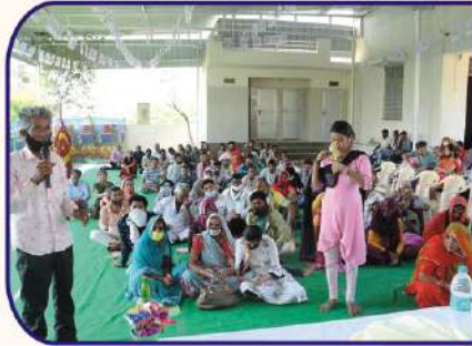
मासिक केम्प में मिर्गी रोगियों के ठीक होने पर अपने अनुभव दूसरे मरीजों को बताते हुए