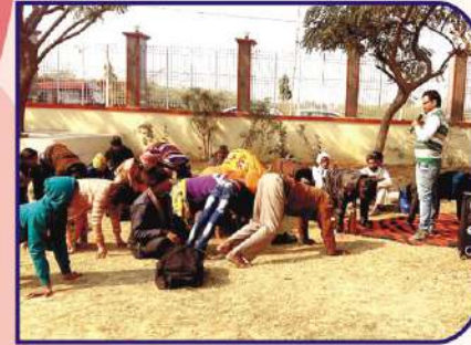
मासिक केम्प में योग विशेषज्ञ द्वारा मरीजों को योगा करवाते हुए।