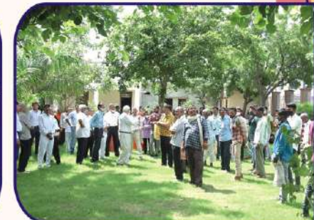
प्राज्ञ मिर्गी निवारक समिति के मासिक केम्प में बगीचे में उपस्थित समिति सदस्य एवं रोगी