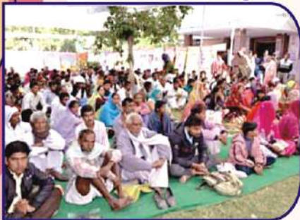
मासिक केम्प में आये हुए मिर्गी रोगी इस रोग के बारे में जानकारियां सुनते हुए