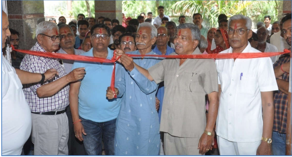
केम्प के लाभार्थी परिवारों द्वारा नवकार मंत्र जाप के बाद में केम्प का उद्घाटन करते हुए।