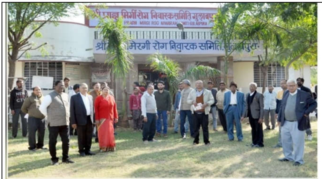
संस्था का भवन एवं बगीचे में खड़े हुए संस्था के सदस्य एवं केम्प के लाभार्थी परिवार