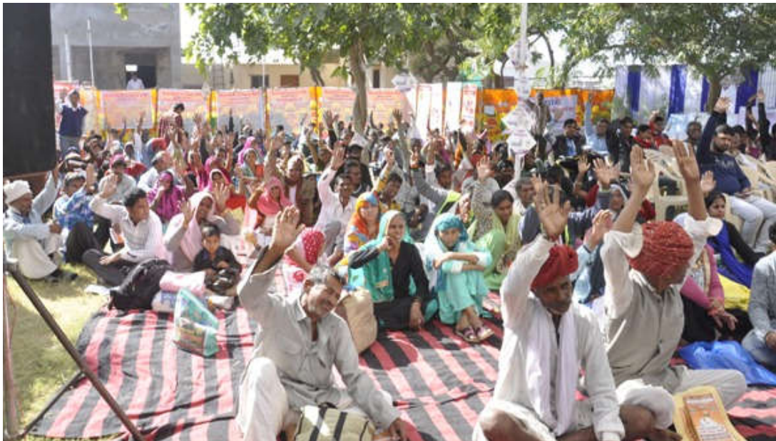
कैंप में मरीज अपने स्वास्थ्य में सुधार होने का इजहार करते हुए।