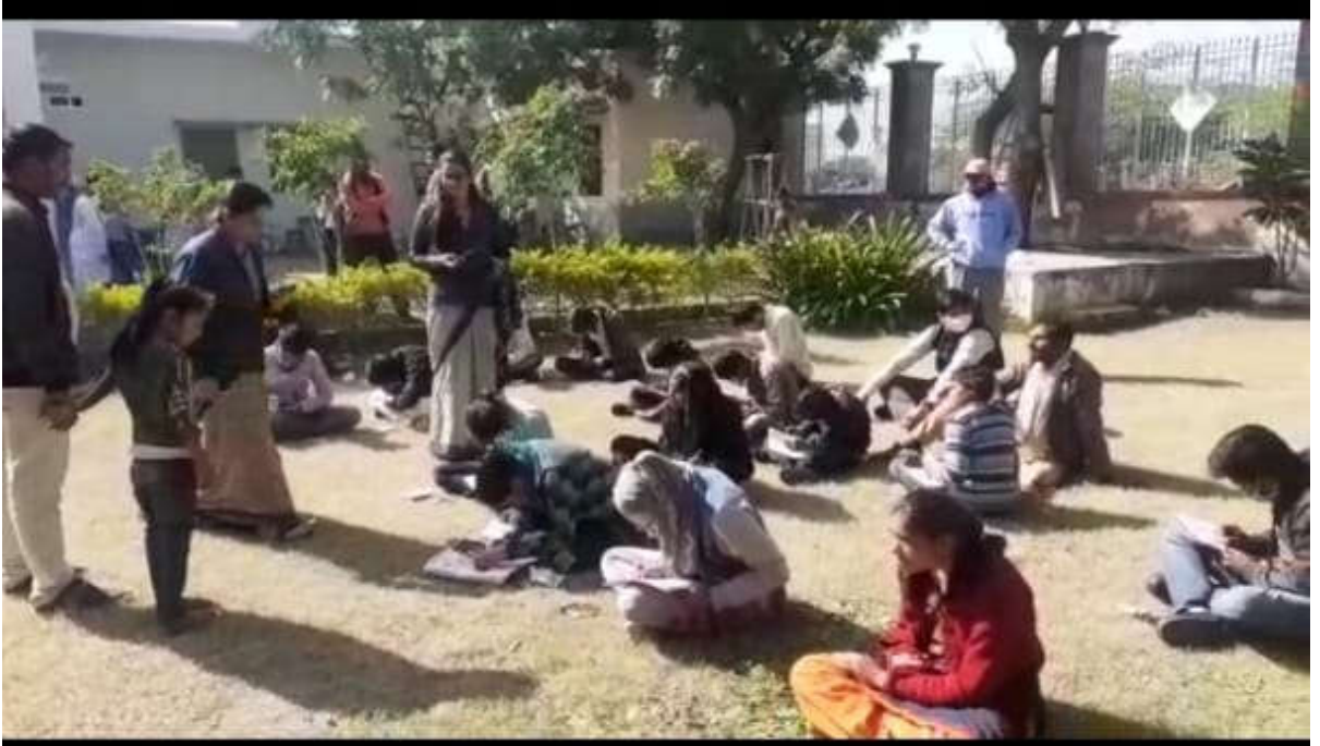
मिरगी रोगी ड्राइंग कम्पीटिशन में भाग लेते हुए। यह कार्यक्रम उनके मानसिक स्थिति को बेहतर करने के लिए कराए जाते हैं।