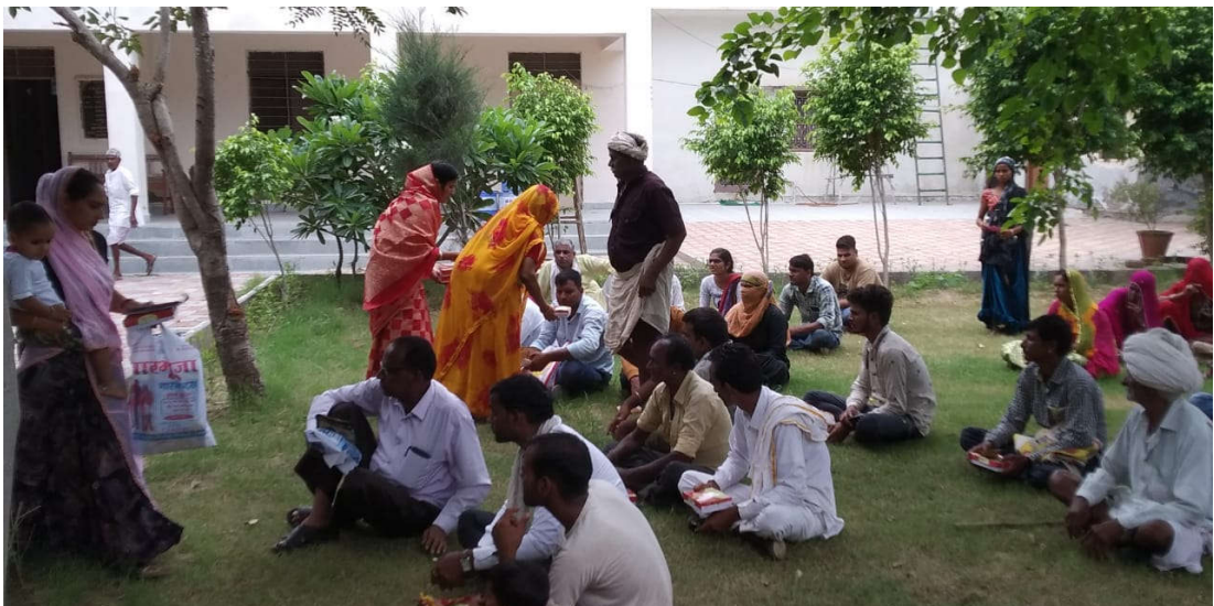
केम्प के लाभार्थी के पारिवारिक सदस्य मरीजों को भोजन पैकेट वितरित करते हुए