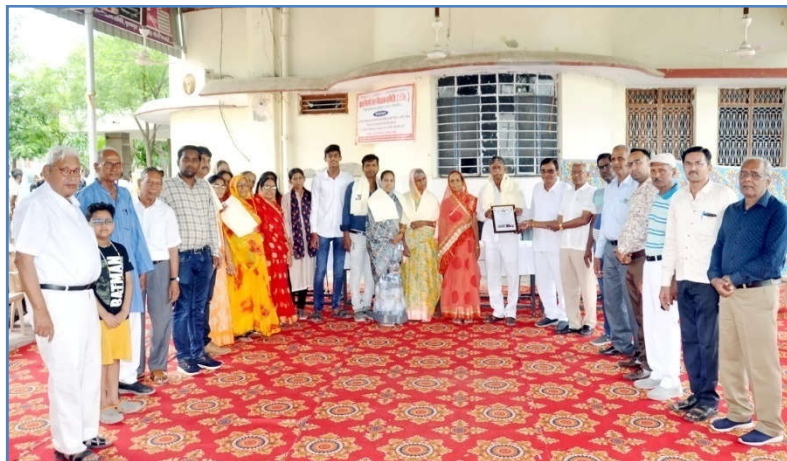
केम्प के लाभार्थी के परिवार का सम्मान एवं प्रशस्ति-पत्र प्रदान करते हुए।